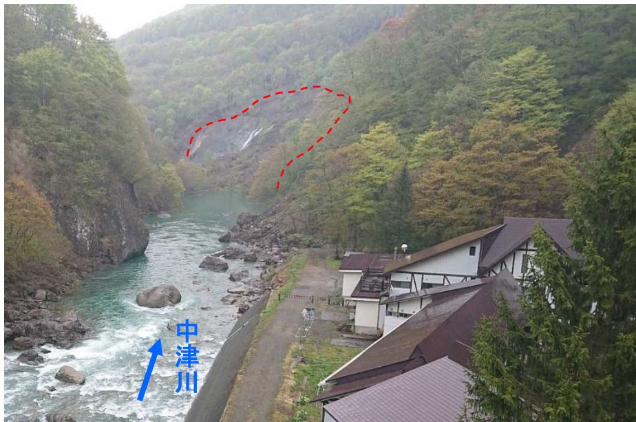
斜面崩壊の状況(上流側より撮影(5/9))