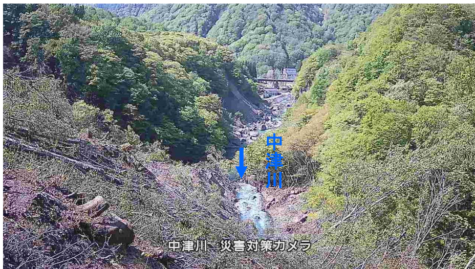
監視カメラによる状況(下流側から監視(5/19))