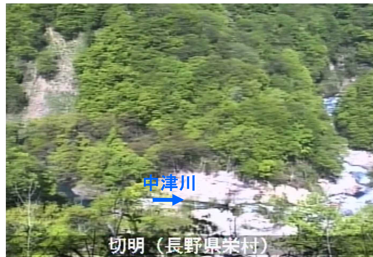
監視カメラによる状況(崩壊地上部から監視(5/19))