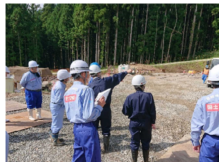
北ノ入川第1号砂防堰堤その4工事のパトロール状況