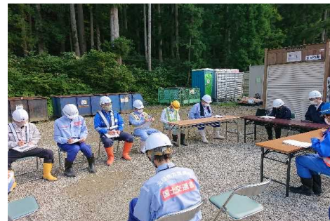
高棚川上流砂防堰堤外工事のパトロール状況