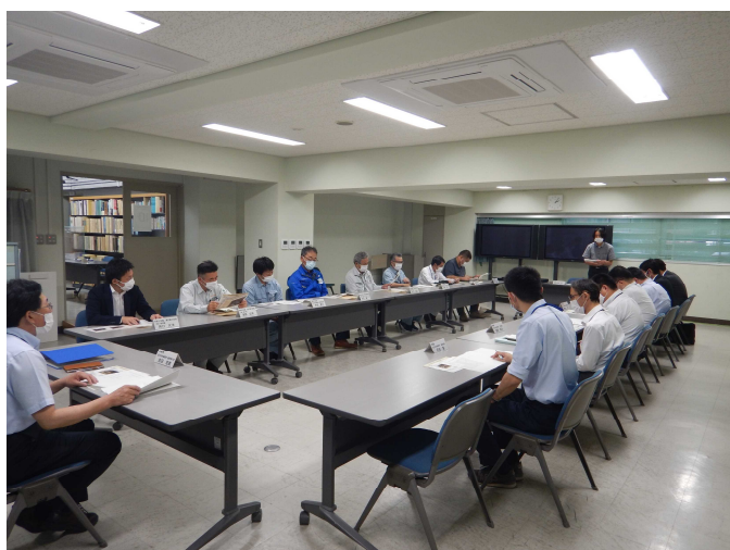
役員会での討議状況