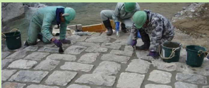
堰堤天端面：石張りイメージ