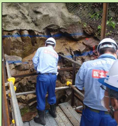
岩盤検査実施状況