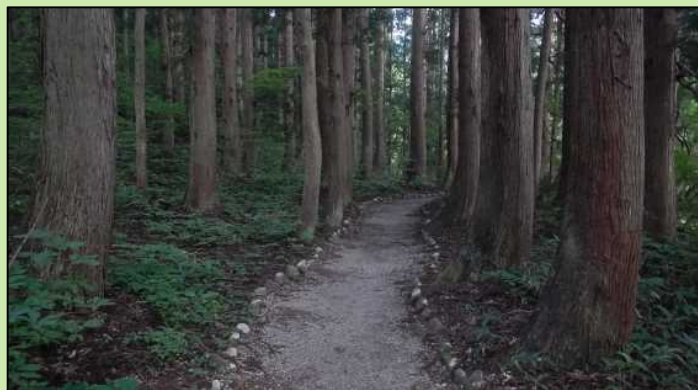
森林の中を通る遊歩道

湯沢砂防事務所のホームページから大源太川第1号砂防堰堤補強工事の最新情報をご覧ください。 アドレスは「 http://www.hrr.mlit.go.jp/yuzawa/ 」です。