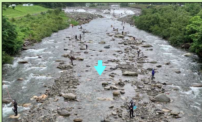
魚野川で鮎釣りを楽しむ釣り人

7月10日（金）に鮎釣りが解禁されましたが、その後、多くの釣人が、魚野川や大源太川に訪れ、太公望となって釣りを楽しんでいます。大物を釣りに来られてはいかがでしょうか。