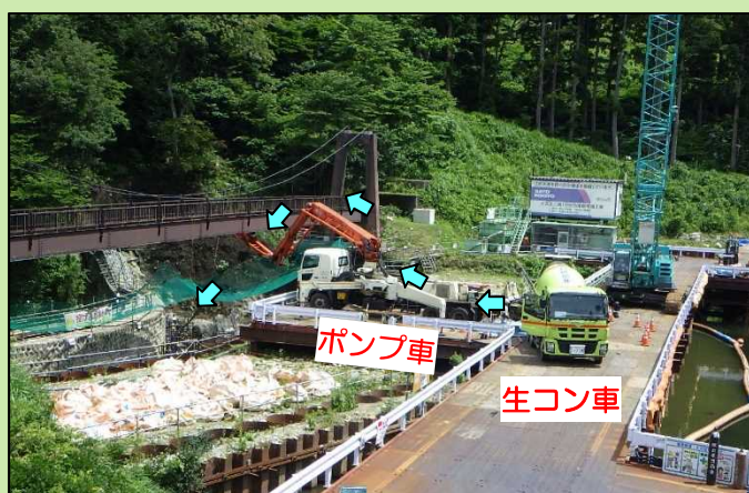
コンクリート圧送状況