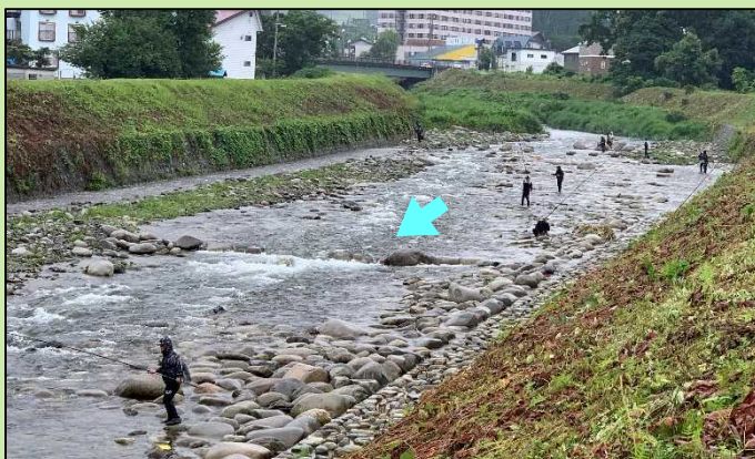
大源太川で鮎釣りを楽しむ釣り人