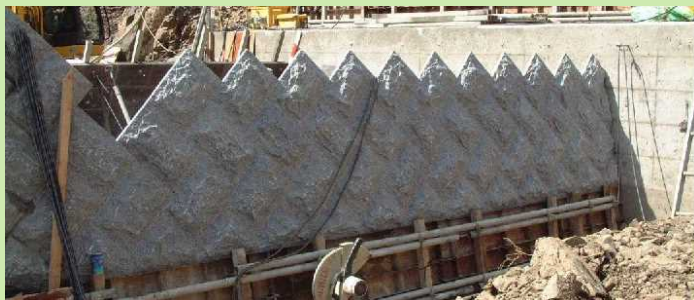
堰堤上流面：石型枠イメージ

新堰堤は景観に配慮した構造物とするため、水通し高さより3m下から上部について、上流側面部に御影石で製作された型枠を使用します。また、天端についても御影石を並べ、旧堰堤との景観を合わせて、コンクリートを打設します。