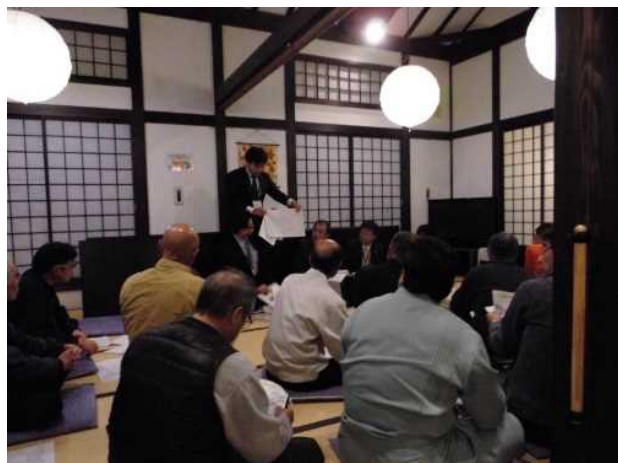
事業進捗説明会実施状況