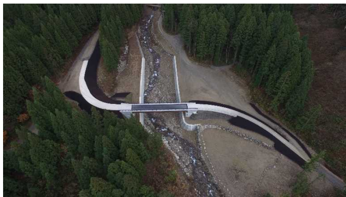
高棚川工事用道路のH30.11状況 （工事用道路を施工しました。）