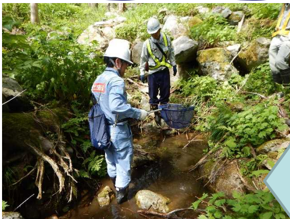
トウホクサンショウウオ 採集の様子

新潟県の貴重な野生動植物の保護で 準絶滅危惧に指定されている トウホクサンショウウオ