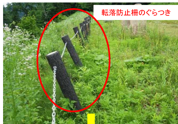
転落防止柵のぐらつき