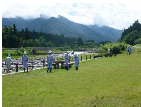
砂防施設周辺の点検の様子