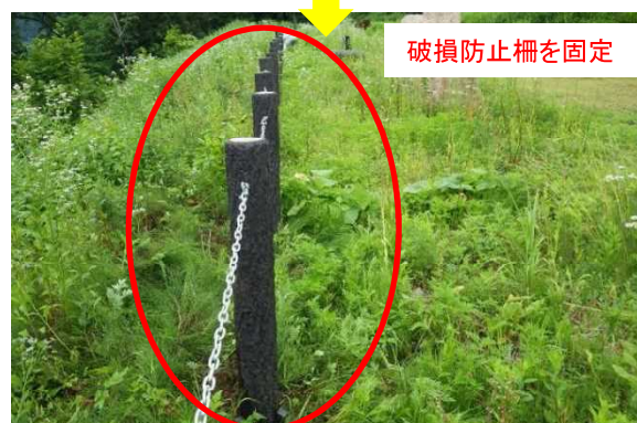
破損防止柵を固定