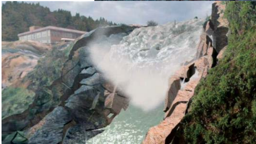
CGで再現した地すべりシーンと危惧された土砂ダム決壊シーン（イメージ）