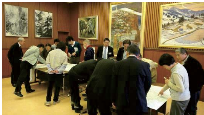
ガイド経験者による意見交換会のようす