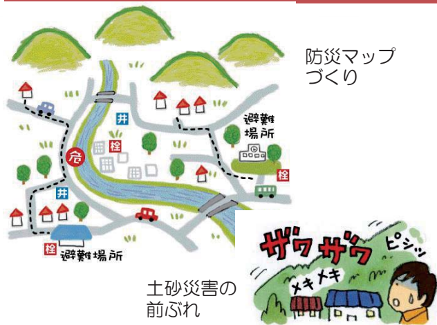
防災マップ づくり