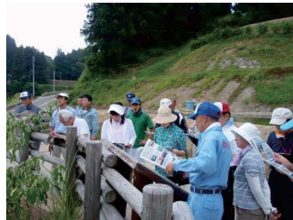
山古志小中学校の先生方の見学会 (ガイドは砂防ボランティア)

砂防の経験者として災害復興のあとを案内しながら、地域の皆さんに如何に砂防というものを分かってもらえるかを考えています。子供たちの防災学習に活かしてもらえたらと、昨年度から山古志小中学校の先生方を対象とした砂防見学会を行っています。