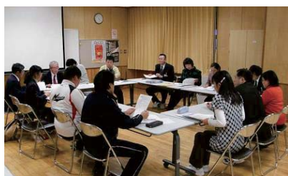
山古志小・中学校 での作成会議