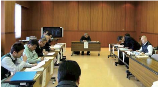
実行委員会開催状況

1月には、ガイド経験のある方々からアドバイスをいただく「ガイド意見交換会」が開催されました。 →詳しくは2ページをご覧ください。