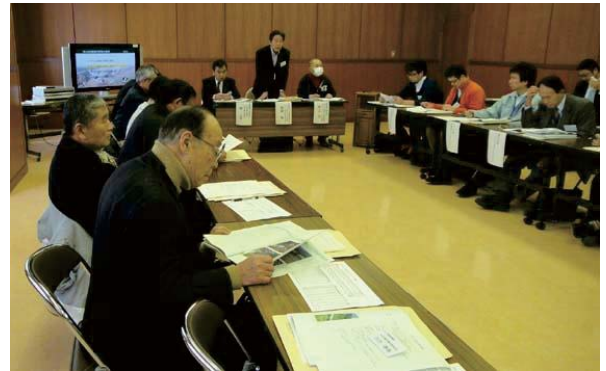
第2回作業部会開催状況

ガイドの現状や課題についての意見交換や地図を使ったガイドポイントのチェックなどをしていただきました。