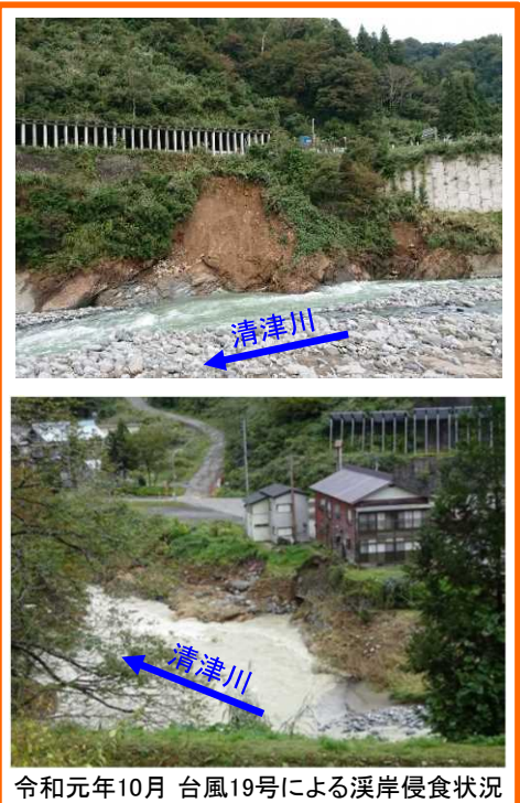
令和元年10月 台風19号による溪岸侵食状況