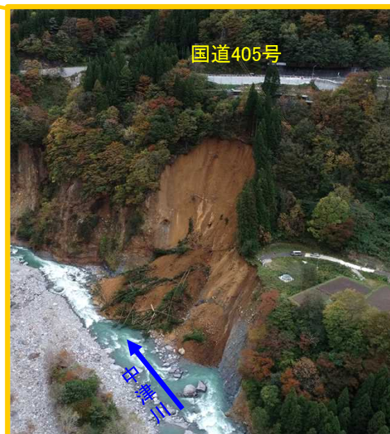
令和元年10月に崩壊が拡大