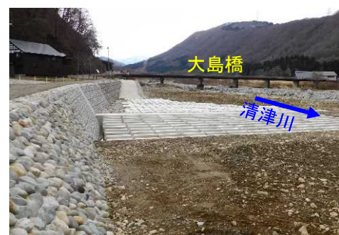
三俣溪流保全工の施工状況