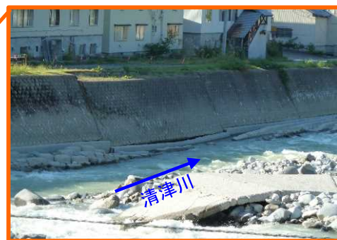
平成25年9月 台風18号で護岸が被災