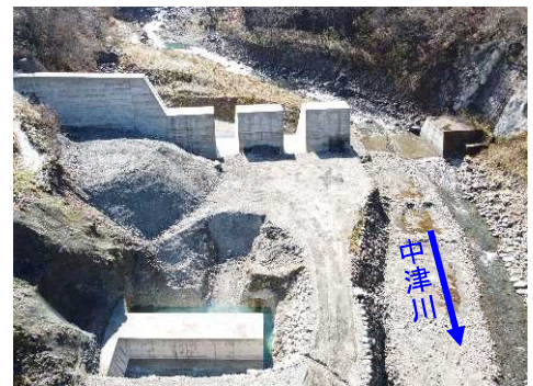
中津川上流2号砂防堰堤の施工状況