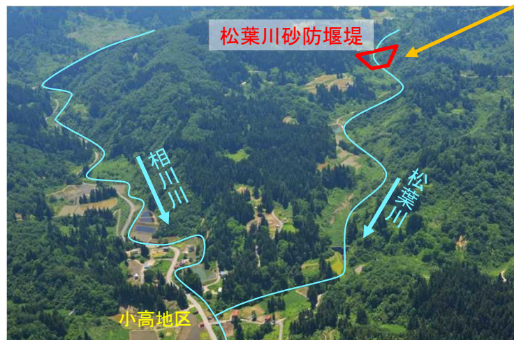
松葉川砂防堰堤 計画場所