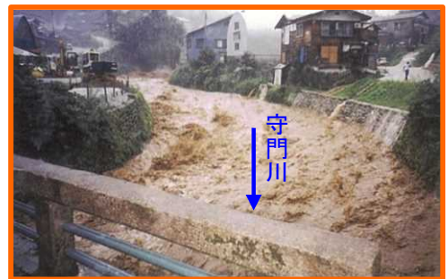
平成10年8月 守門川の増水状況