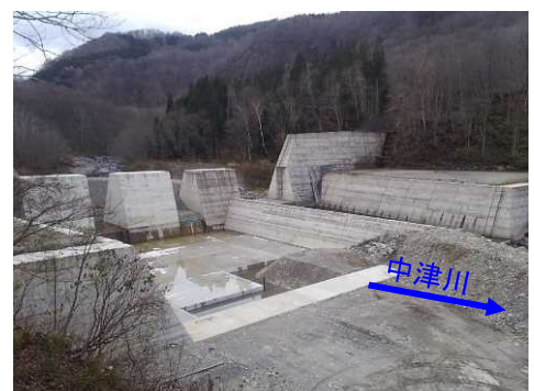
中津川上流1号砂防堰堤の施工状況