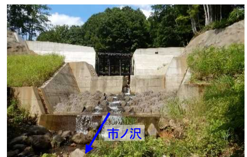
市ノ沢第2号砂防堰堤(令和元年完成)