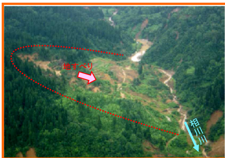
平成16年新潟県中越地震直後の小高地区上流の河道閉塞