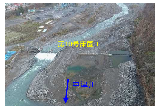
第10号床固工の施工状況