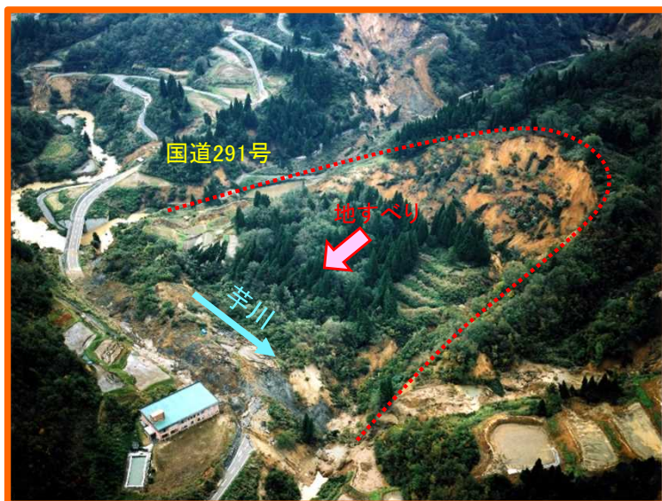
平成16年新潟県中越地震直後の東竹沢地区の河道閉塞