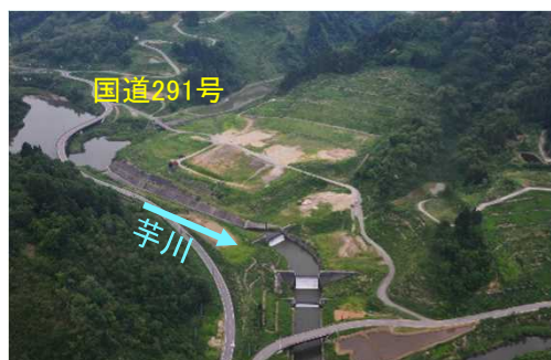
東竹沢砂防堰堤群