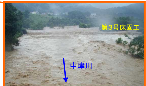
平成25年9月 台風19号での増水状況 (第3号床固工付近)