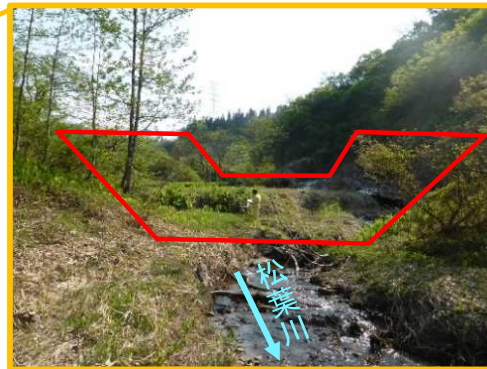
松葉川砂防堰堤計画地の状況