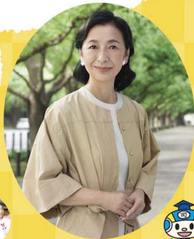
女優 高橋 恵子さん