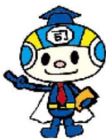
石川県司法書士会イメージキャラクター 「シホーマン」