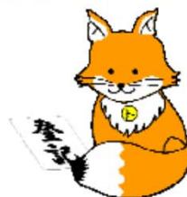
不審命登記推進イメージキャラクター 「トクマツリ」