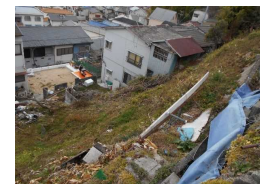
高台から瓦礫や岩石、柵等が落下するおそれ