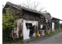
建築物のイメージ