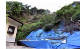
豪雨の度に土砂崩れが多発