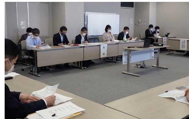
本省土地政策課等より情報提供