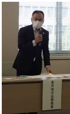
副会長挨拶(金沢地方 法務局:岡本局長)