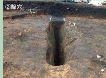
落ちないように気をつけなきゃ