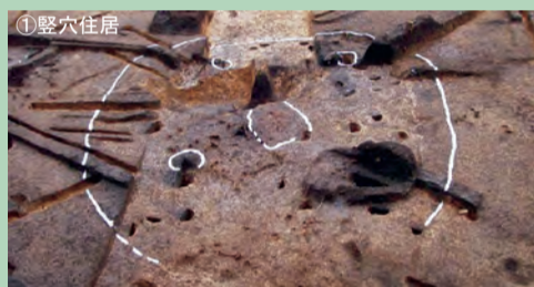
昔の人のお家の跡なんだって