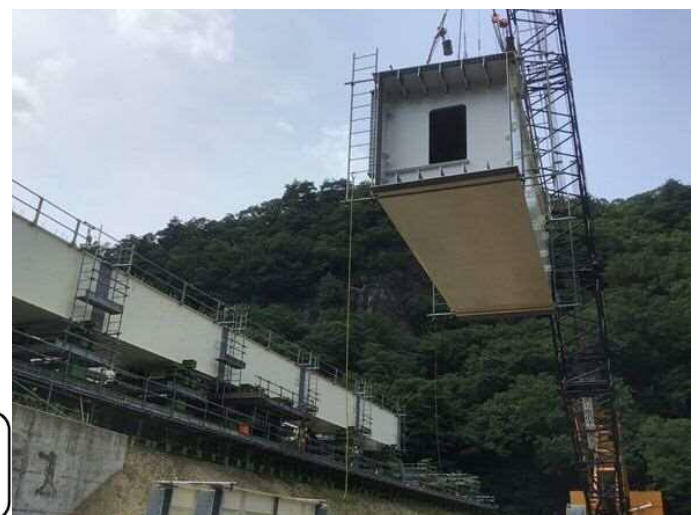
鷹ノ巣道路1号橋梁全景 下部工完成 令和2年8月撮影

製作工場での仮組立全景 令和2年4月撮影 高田機工(株) 和歌山工場(和歌山県海南市)にて