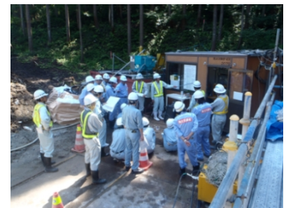
【羽越河川国道事務所職員の見学会】