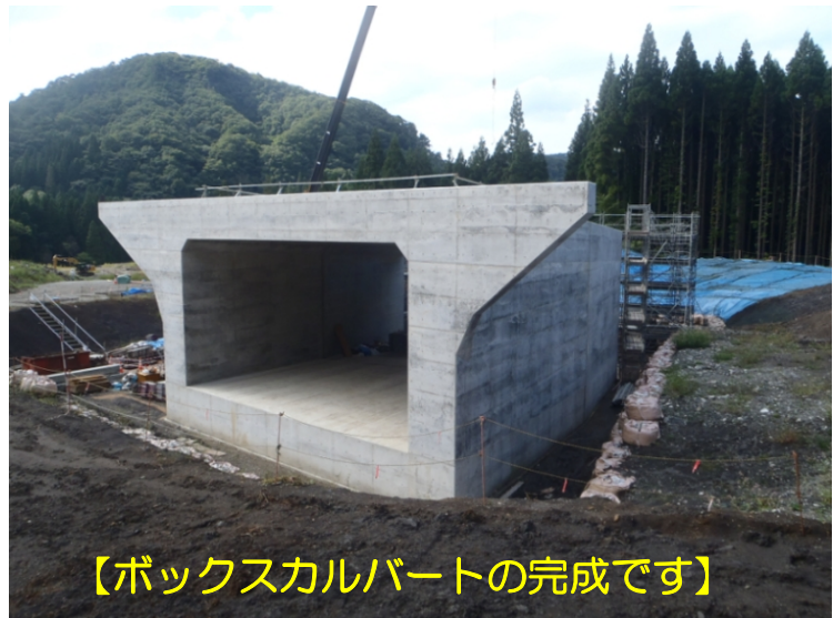
【ボックスカルバートの完成です】