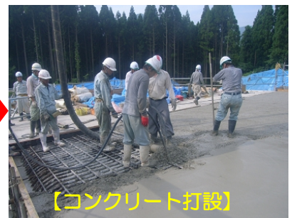
【コンクリート打設】