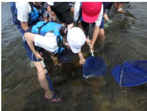
川にすむ生き物を採取