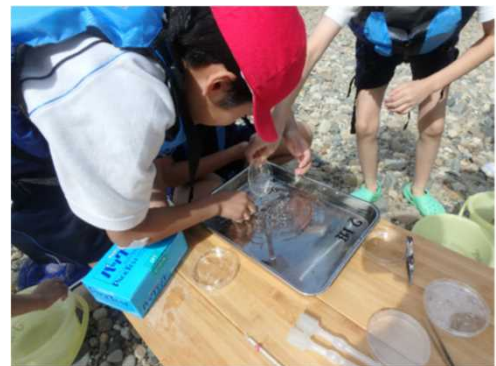
つかまえた生き物を分類