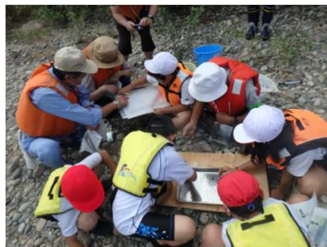
つかまえた生き物を分類