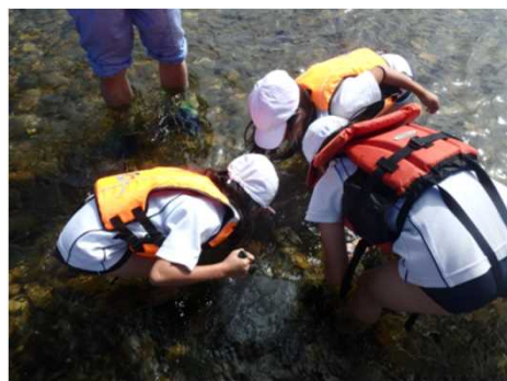
川にすむ生き物を採取