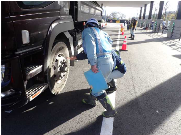
タイヤの状態確認