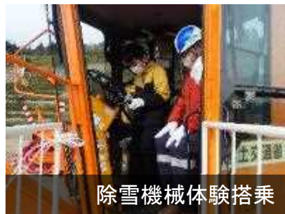
除雪機械体験搭乗