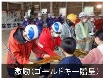
激励(ゴールドキー贈呈)