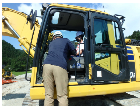
バックホウ試乗体験