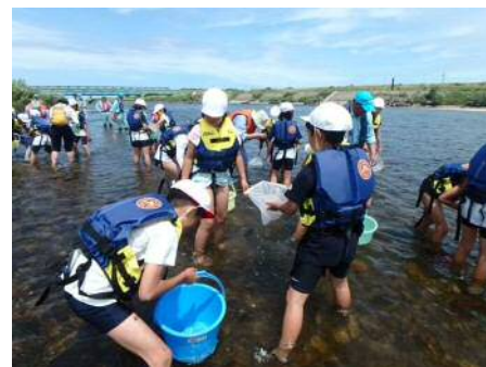
川にすむ生き物を採取