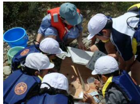
つかまえた生き物を分類