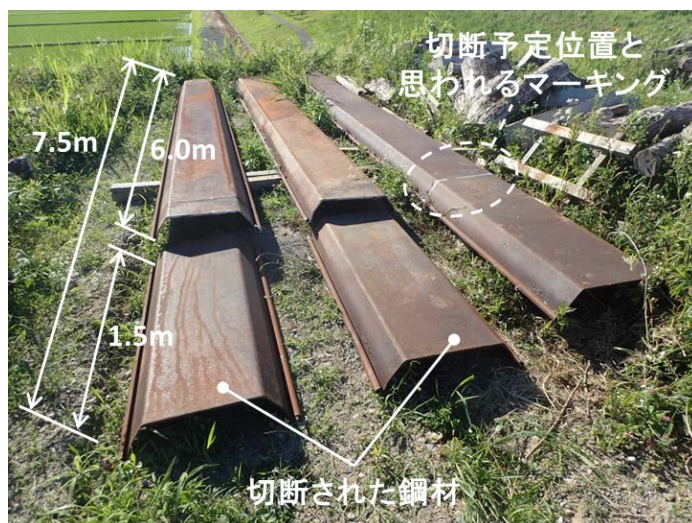
【写真】器物損壊状況