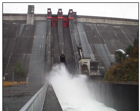
ダム放流時の様子