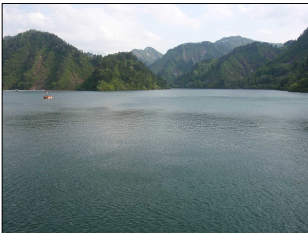
貯水位を下げ前の おおいし湖

その洪水を貯め込むための容量を確保するため、前もって貯水位の低下するものです。貯水位を低下させる事により、新潟県庁約94杯分の容量（洪水調節容量）を確保します。