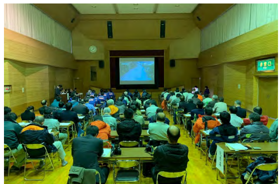
【昨年度の技術研究発表会状況】