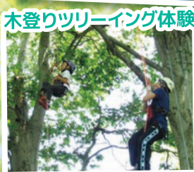
木登りツリーイング体験