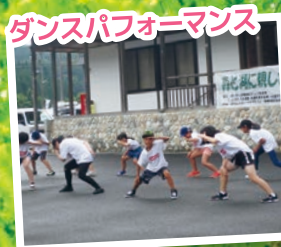
ダンスパフォーマンス