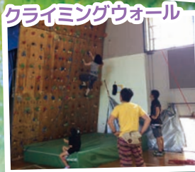
クライミングウォール