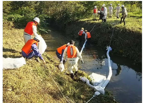
オイルフェンスの設置訓練（H29）