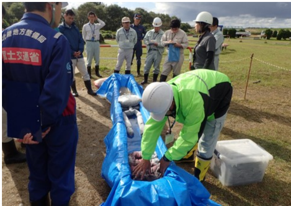
側溝での油回収方法の説明（H29）