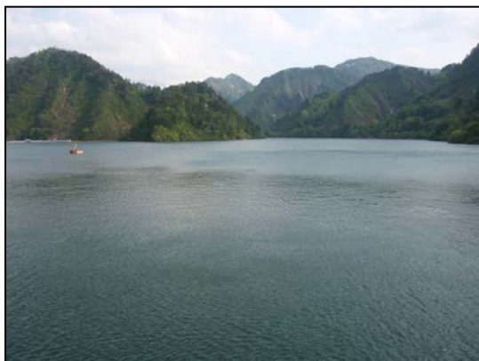
貯水位を下げ前の大石ダム湖（過年度参考）

そのため、洪水期に入る前に水位を下げ新潟県庁約94杯分の容量を確保し下流地域の被害発生を軽減します。