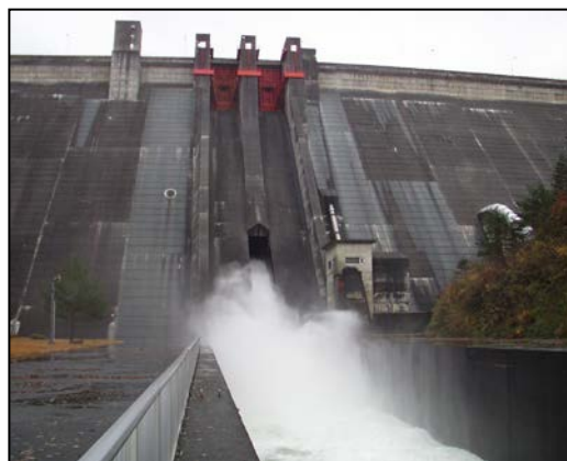
ダム放流時の様子