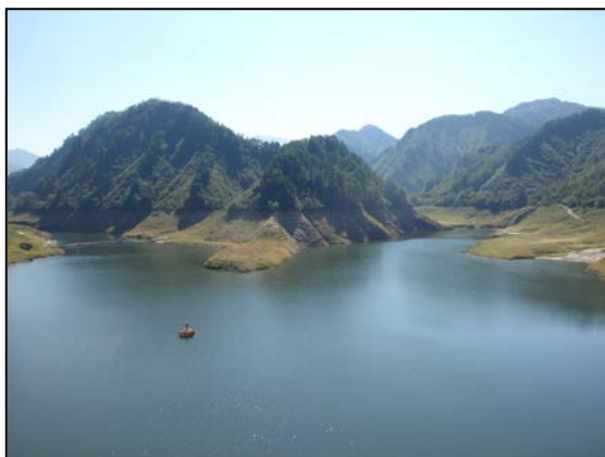
貯水位を下げた大石ダム湖（過年度参考）