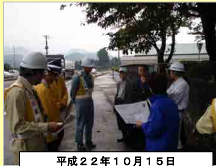
平成22年10月15日 沿道地域の方々といっしょに 現地を点検・意見交換