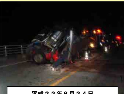
平成22年8月24日 重大事故発生

沿道間近で起こる重大事故の原因を地域の方々にも理解頂き、地域の方々の要望を踏まえたうえで対策方針を決定します。