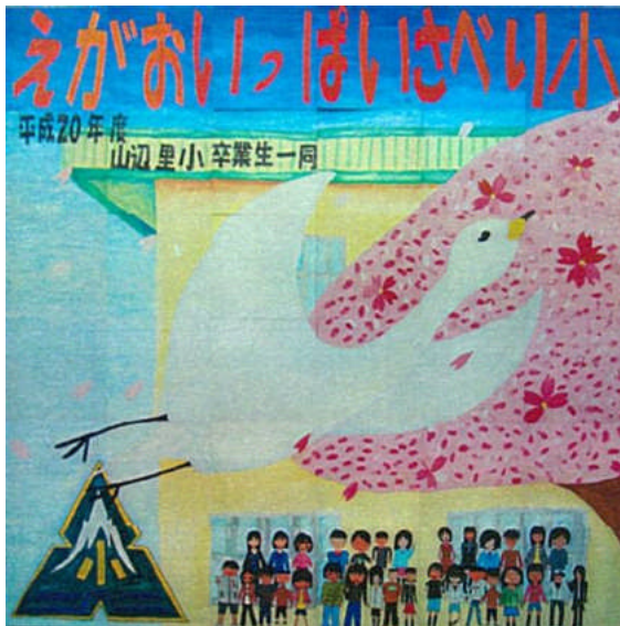
▲記念パネル全体イメージ