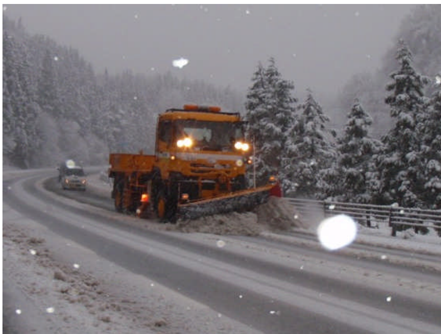
【国道7号村上市大沢地先における除雪作業状況】