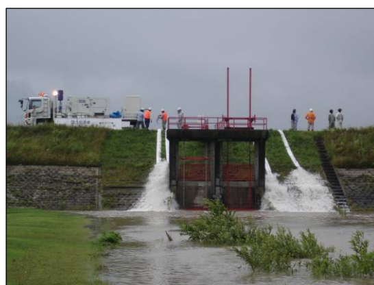
H16 出水出動状況(村上市鳥屋地先)