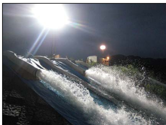
夜間訓練の様子(H21年度)