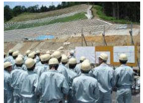
6月に実施した現場見学会の様子