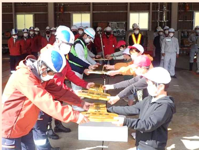
除雪作業受注者への激励