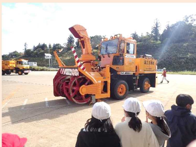
除雪機械のデモンストレーション