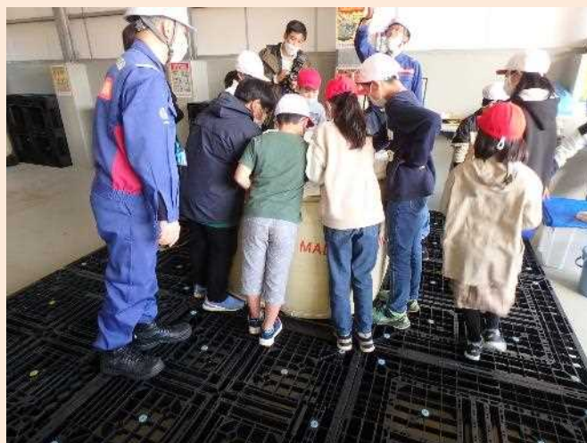
凍結防止剤に触ってみる