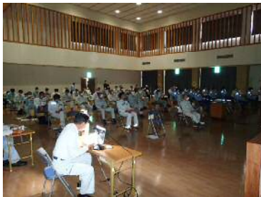
受注者による安全管理の取り組み報告