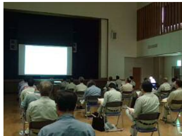
発注者による工事事故の発生状況と安全管理