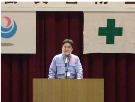
開会挨拶（羽越河川国道事務所長）

また、「建設労働災害防止大会」に先立ち、新発田労働基準監督署と合同で安全パトロールを実施しました。