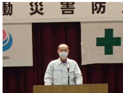
講話（新発田労働基準監督署長）