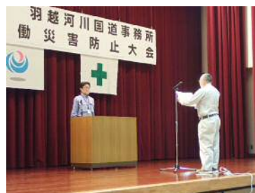
受注者代表による安全宣言