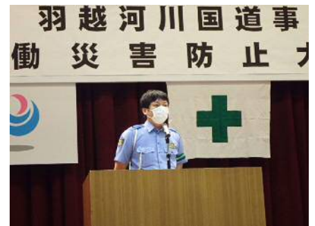
講話（村上警察署 交通課長）