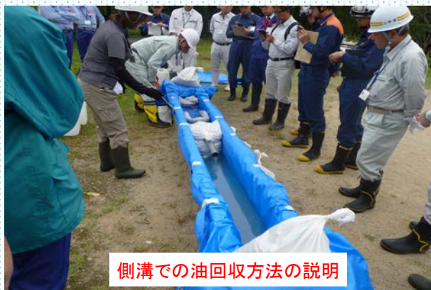
側溝での油回収方法の説明