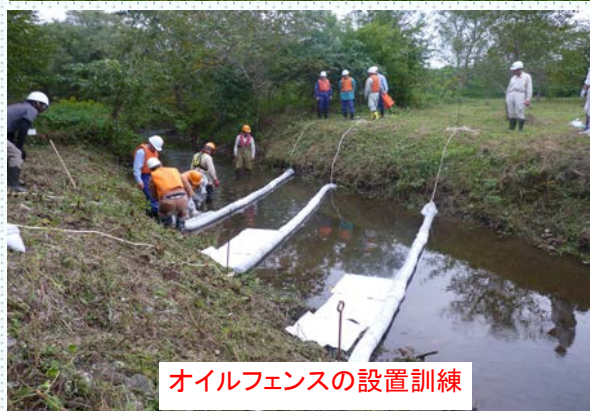
オイルフェンスの設置訓練