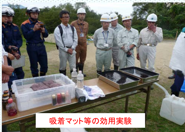
吸着マット等の効用実験

訓練に先立ち、水質事故が及ぼす影響、油処理剤の性質と使用上の注意事項、油吸着マットの性能による使い分け、側溝での油回収時の留意点、オイルフェンスの設置方法の説明を受けた後、3班に分かれて川の水面に吸着型オイルフェンスを設置する実技訓練等を行いました。