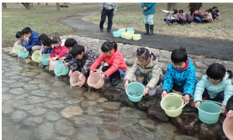
園児達の稚魚放流の様子