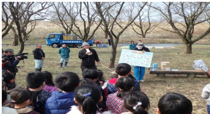
サケのお話を聞く

園児の皆さんは、一人一人、稚魚が入ったバケツを持ち、「大きくなって、帰ってきてね」と声をかけながら川へ放流してくれました。