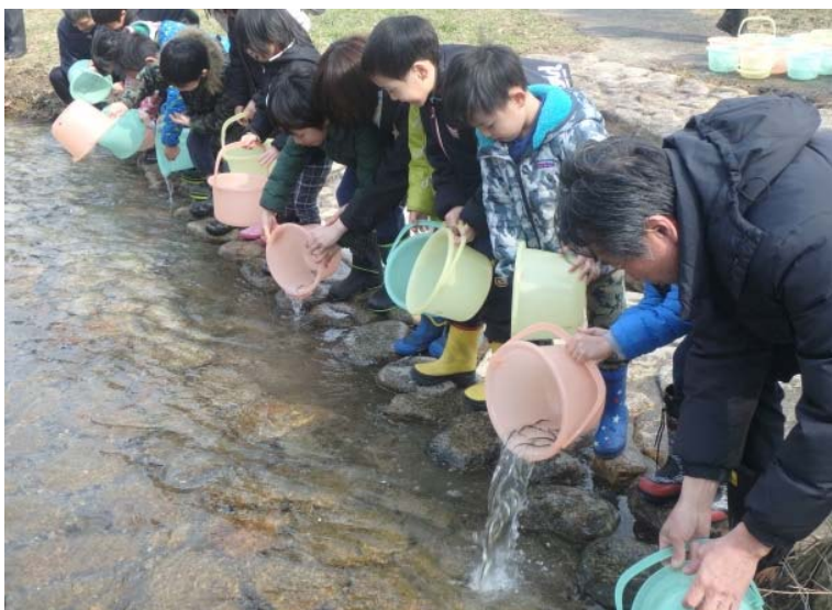
園児達の稚魚放流の様子