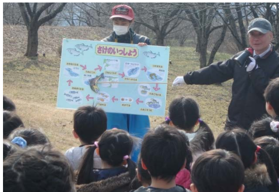
サケのお話を聞く

園児の皆さんは、一人一人、稚魚が入ったバケツを持ち、「大きくなって、帰ってきてね」と声をかけながら川へ放流してくれました。