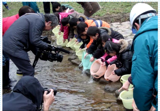
園児達の稚魚放流の様子