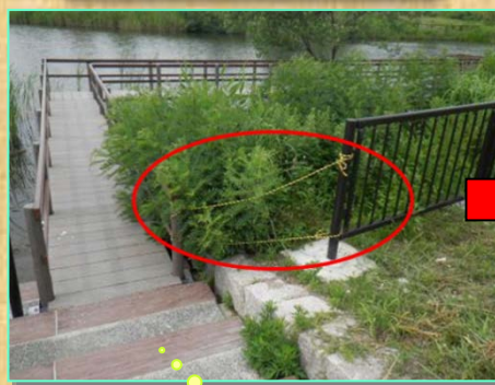
ロープの隙間が大きい