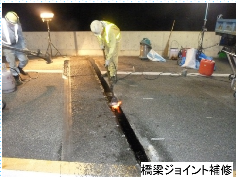
橋梁ジョイント補修