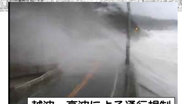
越波・高波による通行規制（村上市伊呉野地先）