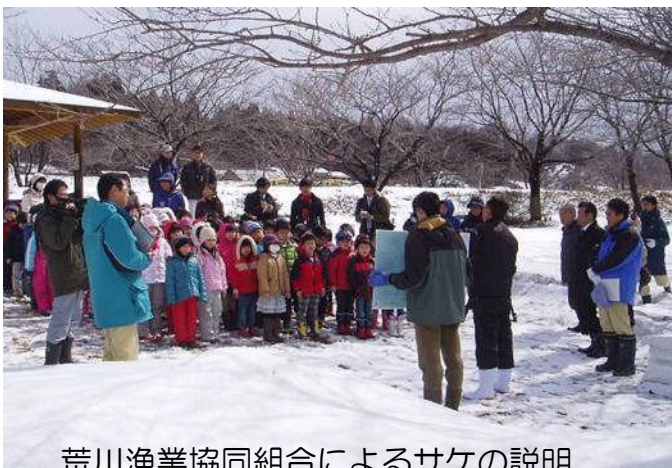
荒川漁業協同組合によるサケの説明

園児の皆さんは、一人一人、稚魚が入ったバケツを持ち、「大きくなって、帰ってきてね」と声をかけながら川へ放流してくれました。