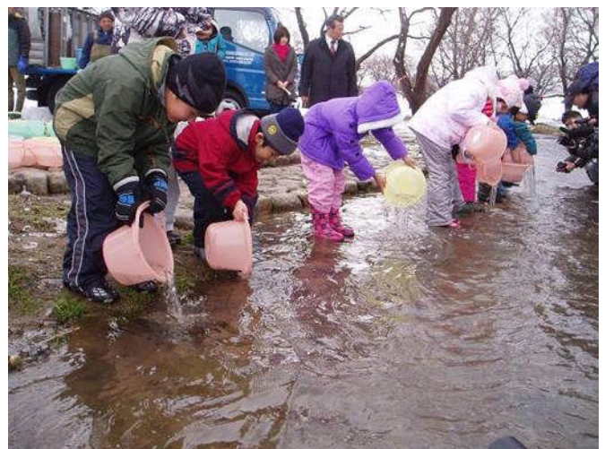
園児達の稚魚放流の様子