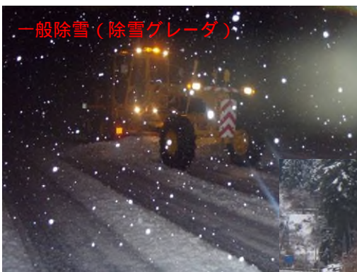
一般除雪(除雪グレーダ)

今冬 : 平成23年12月10日 昨年より 5日早い 稼働 (昨年 : 平成23年12月15日)