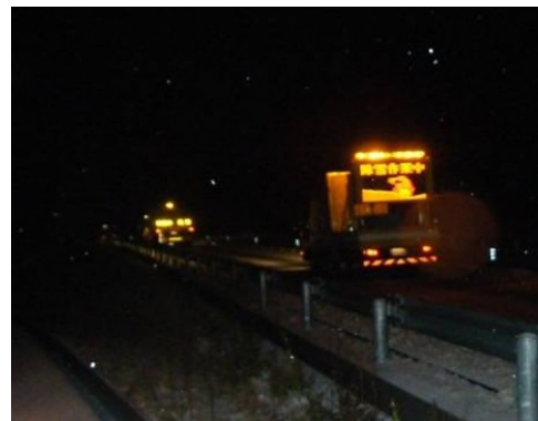
(村上瀬波温泉IC～村上山辺里IC間) (積雪量5cm)