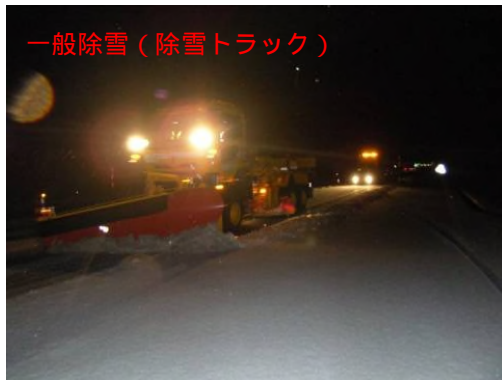
一般除雪(除雪トラック)

今冬 : 平成23年12月9日 昨年より 16日早い 稼働 (昨年 : 平成22年12月25日)