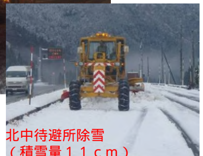
北中待避所除雪 (積雪量11cm)