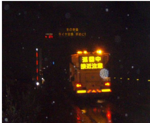
大須戸除雪ステーションを出動(1日0時20分)