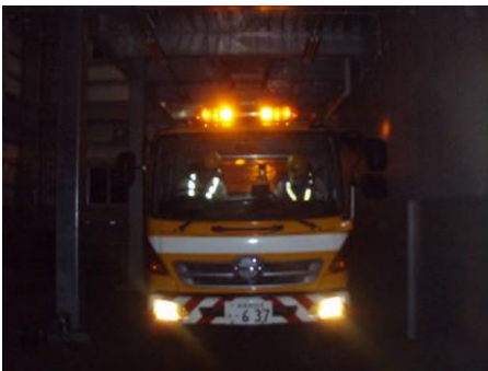
凍結防止剤の積み込み作業 (大須戸除雪ステーション)