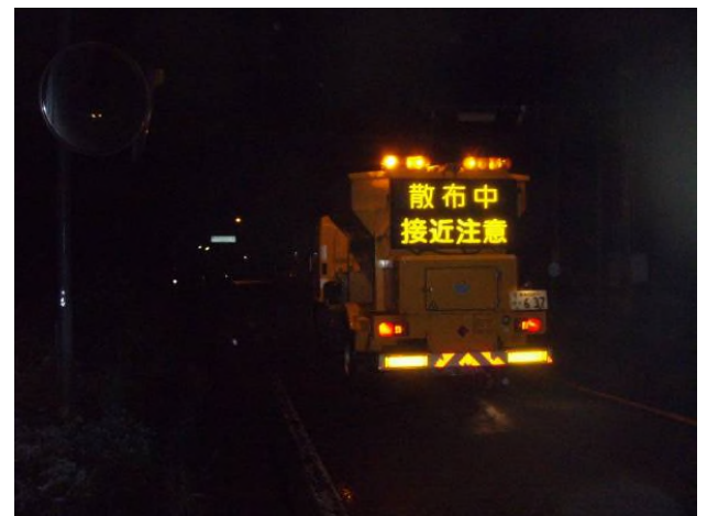
凍結防止剤散布状況(村上市大須戸付近)