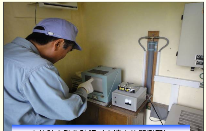
水位計の動作確認（小渡水位観測所）