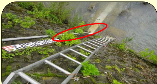
水位標の破損（滝川水位観測所）

なお、一部の水位標等で補修を必要とする箇所を確認したため、早急に補修を行う予定です。