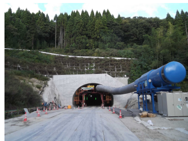
氷見第15トンネル（仮称）