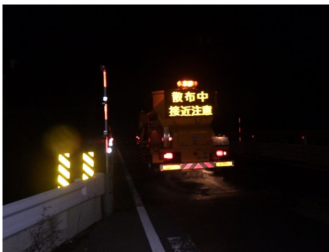
かたかけ 国道41号富山市片掛における作業状況