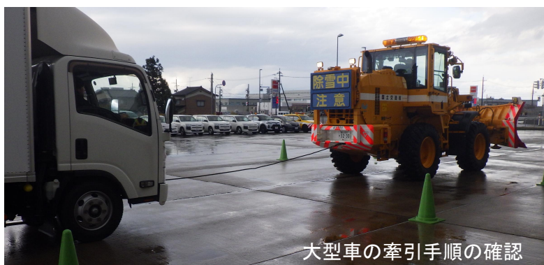
大型車の牽引手順の確認