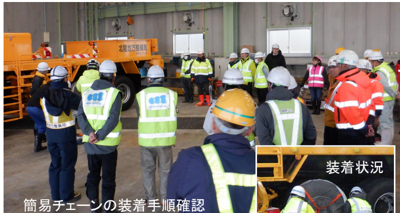
簡易チェーンの装着手順確認