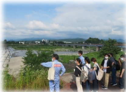
常願寺川(富山市上滝地区)