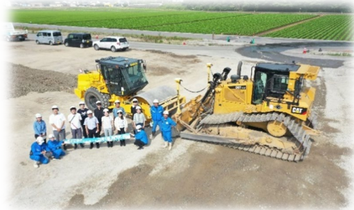
おおさわのとやまみなみ ふくい 国道41号大沢野富山南道路(富山市福居地区)