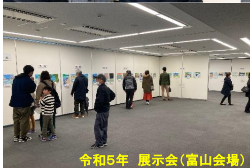
令和5年 展示会(富山会場)