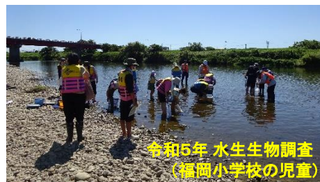
令和5年 水生生物調査 (福岡小学校の児童)